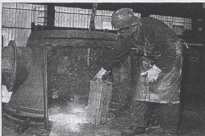
Asturias duplicó entre julio y septiembre de 2006 las contrataciones realizadas en el mismo período de tiempo en 2005.