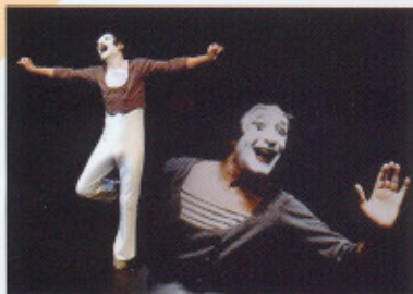
El buen comunicador acaba ganándose a la gente

En el ámbito empresarial, nos encontramos con muchas situaciones en las que el lenguaje corporal es un poderoso aliado para el logro de nuestros objetivos. Si bien es cierto que detrás de una exitosa conferencia, negociación o presentación de negocios siempre hay una buena preparación, no es menos cierto que debe existir una perfecta sintonía entre las palabras que pronunciamos y nuestros gestos y movimientos corporales. Es esa sintonía la que transmite credibilidad y confianza en la persona o personas a los que nos dirigimos.