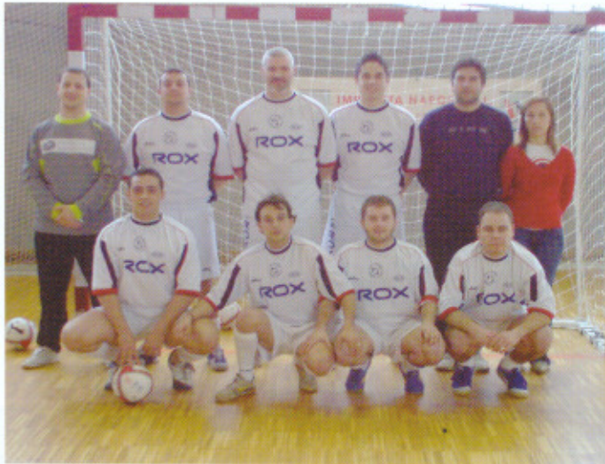
Equipo de Fútbol Sala Club Nodular