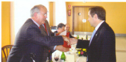
Premio Ideas Innovadoras