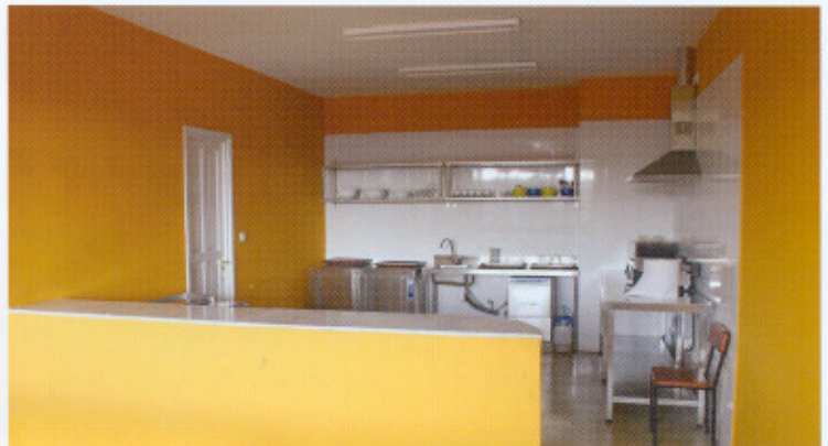
A principios del 2005, se llevó a cabo una mejora en nuestro comedor de la fábrica, cuyo resultado puede verse en estas fotografías.

También se ha reformado el Torno Herkules CNC, ampliando su bancada en 1.500 mm. además de revisar el cabezal, el contrapunto y los carros, permitiendo de este modo pasar de dos turnos a un 3T4 que supone desbastar unas 1.200 Tm. de cilindros más al año.