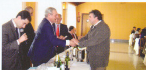
Premio al Trabajo José Suñer