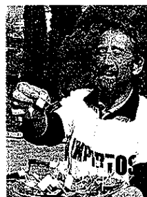
Protesta de docentes.